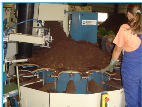
opening in the front with turning disc Öffnung im vorne der Maschine mit drehendes Platte