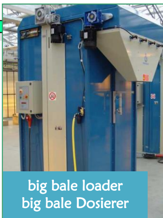
big bale loader big bale Dosierer