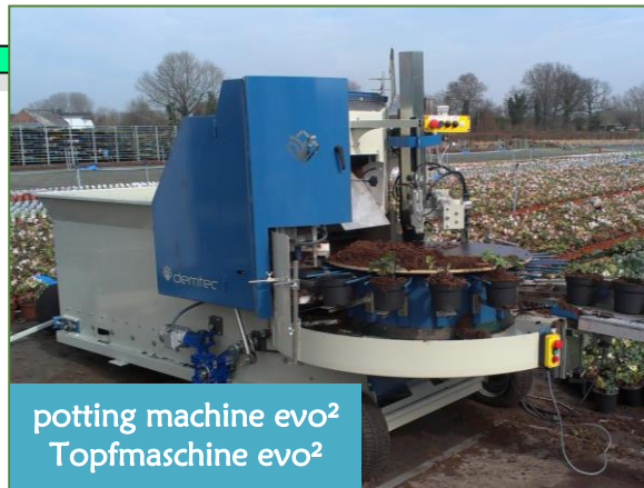
potting machine evo 2 Topfmaschine evo 2