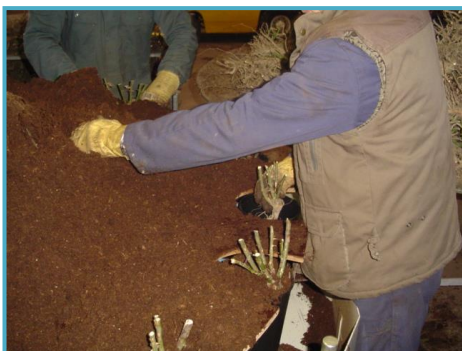
bare root potting Topfen von nackte Wurzel