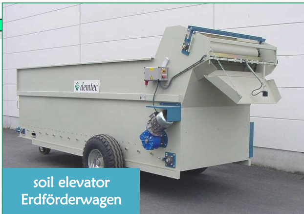
soil elevator Erdförderwagen