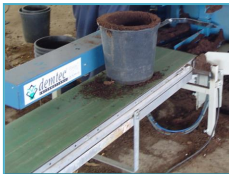
drilling upto Ø 27 cm Bohrer bis Ø 27 cm