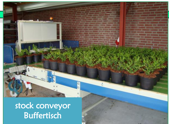
stock conveyor Buffertisch